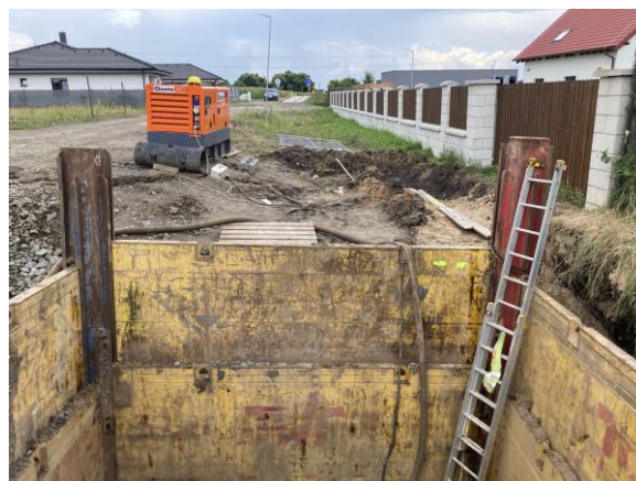
ČSOV 2 – zajištění stavební jámy