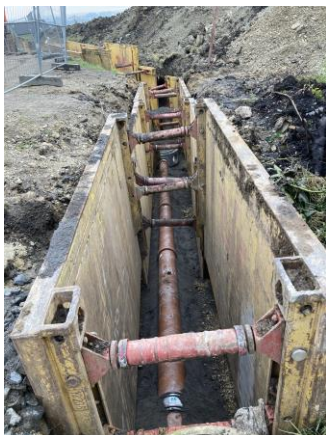
Stoka BA-1 – pokládka trub