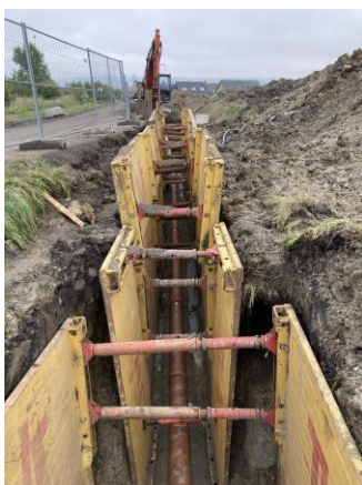
Stoka BA-1 – pokládka trub