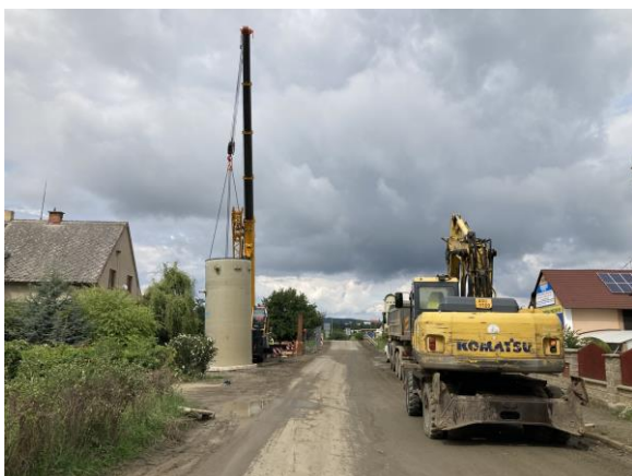
ČSOV 1 – uložení čerpací jímky