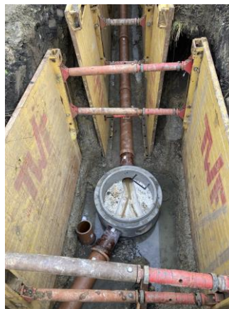
Stoka BA-1 – usazení revizní šachty