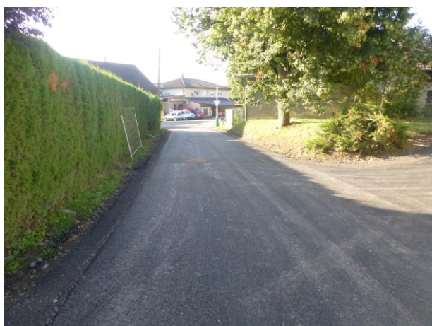
Obnova povrchů místních komunikací