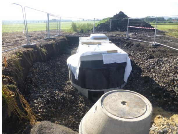
Osazené a přispané nádrže ČSOV 1