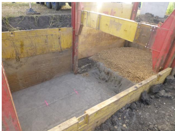
Upravené podklady pro ČSOV 1