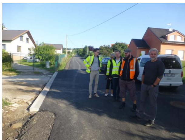
Obnova povrchů místních komunikací