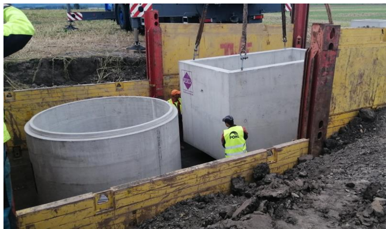
Osazení nádrží ČSOV 1