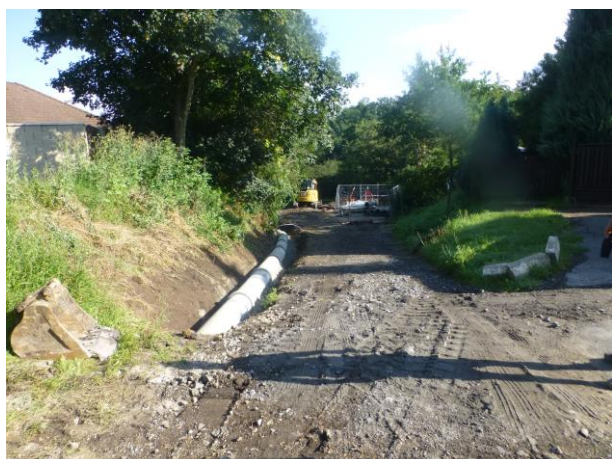
Čerpací stanice ČS4 – komunikace a odvodnění