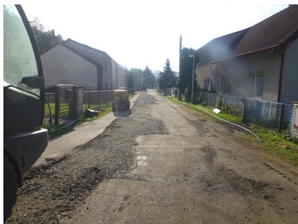
C1 – provizorní povrchy