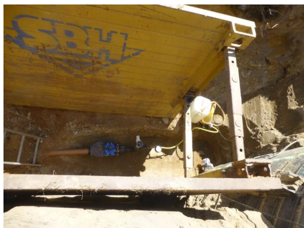
Tlaková zkouška potrubí V2