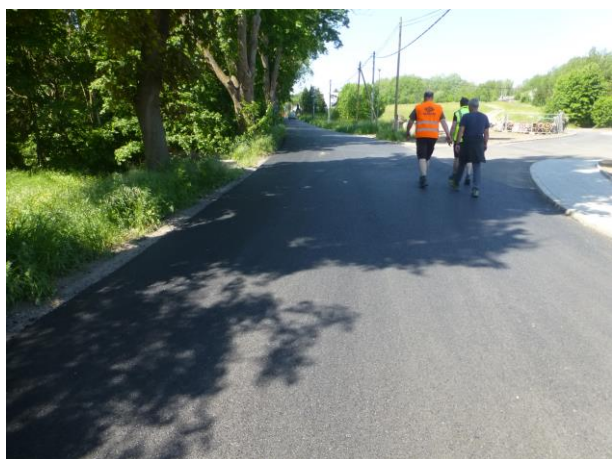
Nový povrch na C3 směr Bítouchov