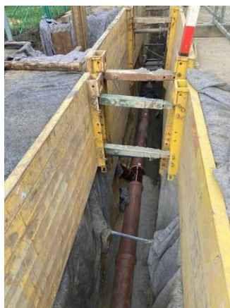
Stoka A – pokládka kanalizačních trub