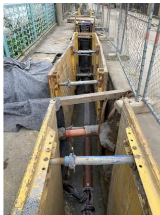
Stoka A - pokládka kanalizačních trub