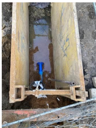
Vodovod V1 – realizace přeložky vodovodního řadu