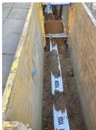
Vodovod V1 – zásyp stavební rýhy