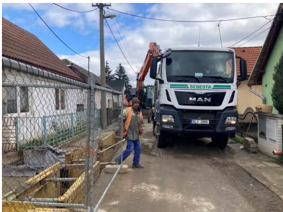
Stoka A – průběh stavebních prací