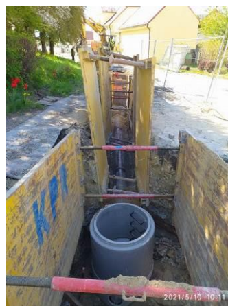
Kanalizační stoka 2S