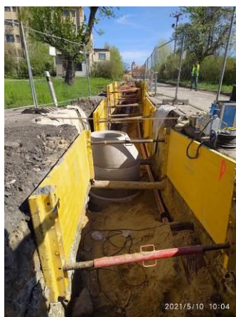
Souběh výtlačku a kanal.stoky 3S