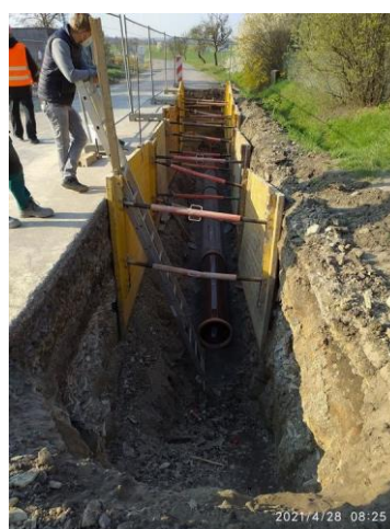
Kanal.stoka 3S u ČSII.