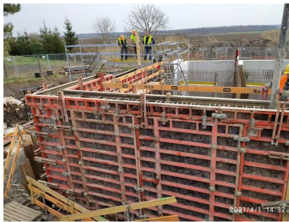
Betonáž stěn nádrží ČOV