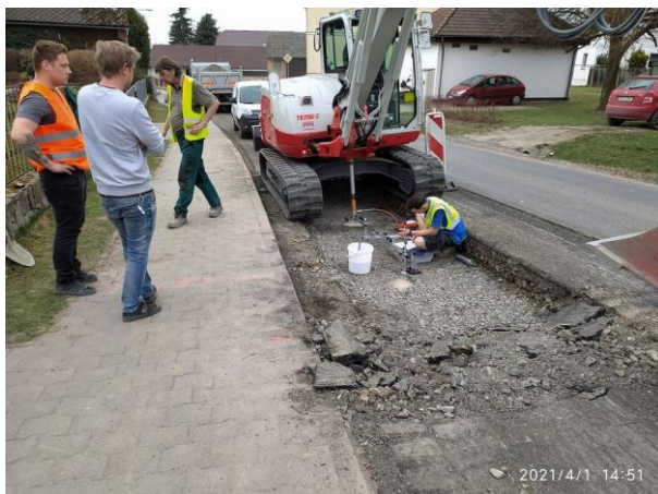
Podkladní vrstvy komunikace KSÚS-stat.zat.zk.