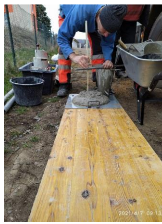
Zkoušky betonu ČOV