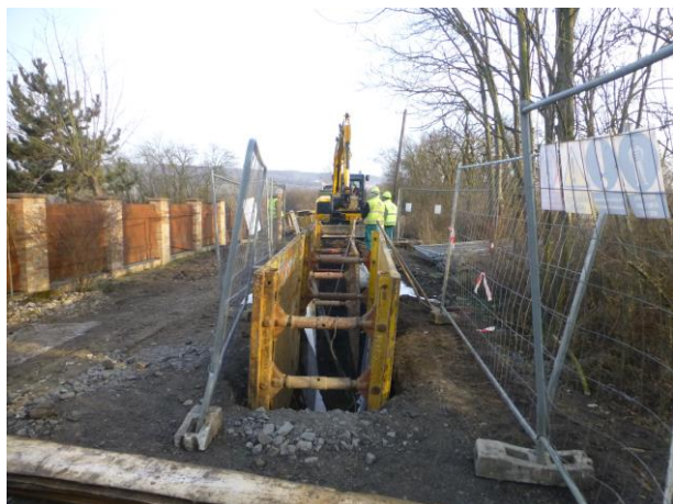
Pracoviště Chaloupky – stoka A, V1