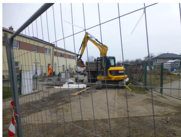
Přípojky na BD4-3