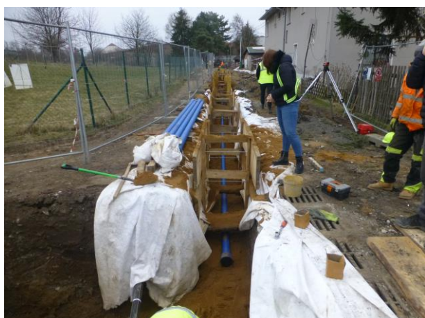
Přeložka vodovodu na BD4-2