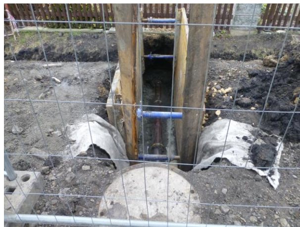
Přípojka na stoce A